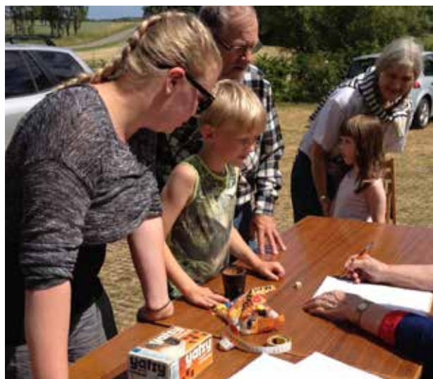
Foto: Fra børneklubben.

Næste gang bliver den 3. august i Førslev.