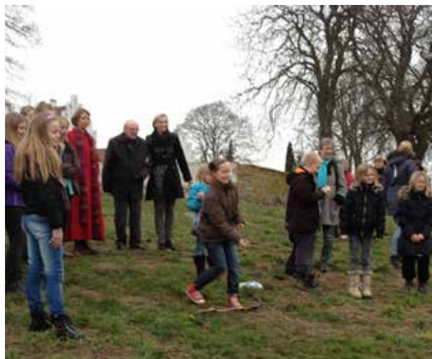
Foto: Fra æggetrilmingsdyst 2016.

Som udgangspunkt finder dåb sted ved en højmesse, enten en søndag eller anden helligdag. Det kan også lade sig gøre ved en anden søndagsgudstjeneste. Barnet døbes ind i menigheden, og menigheden tager imod barnet. Hvis særlige forhold taler for det, kan man dog afholde lørdagsdåb. Der er mulighed for lørdagsdåb en gang i kvartalet i det sogn, hvor der først anmodes om det. Det er den 1. lørdag i månederne februar, maj, august og november. Næste gang bliver den 6. maj i Førsløv.