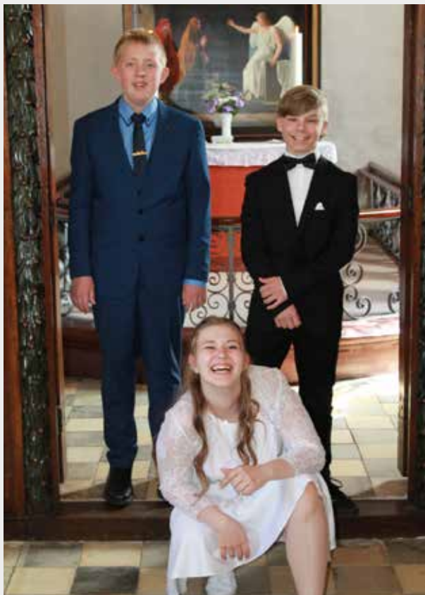
Foto: Konfirmander i Bråby kirke 29.4.2018