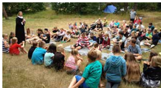
Søndagens gudstjeneste er ikke kun for lejrdelegerne, men også for sognene – velkommen til en gudstjeneste i det fri søndag den 22.7. kl. 11.00.