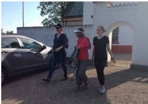
Foto: Kristi himmelfartsvandring 2018