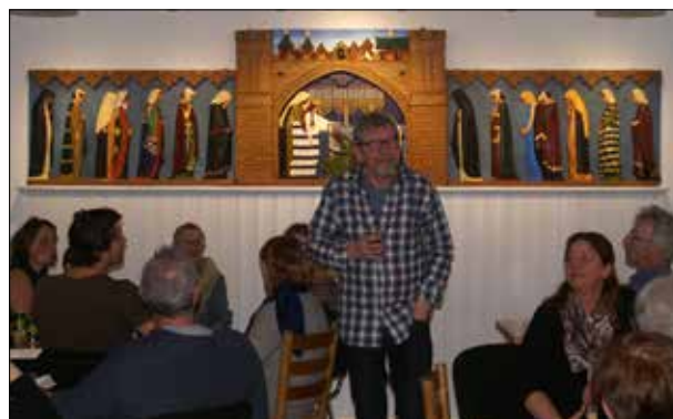
Foto: Fernisering af Dagmarrelieffet i Øde Førslev i præstegårdsladen.