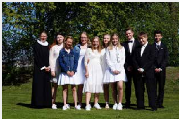
Foto: ø. Konfirmander i Teestrup kirke 27.4.2018 Foto: n. Konfirmander i Øde Førslev kirke 6.5.2018